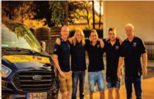
(Sponsor: Dachdeckerei Spenglerei Wolfgang Pescolderung, Hallbergmoos)

Nach der dominierenden Saison 2016/2017 als F2 mit 15 Siegen in 15 Spielen und sagenhaften 115:17 Toren, ging es für „die Unbesiegbaren“ (lt. Pressebericht) als F1 in die Saison 2017/2018 in der Gruppe 1 weiter.