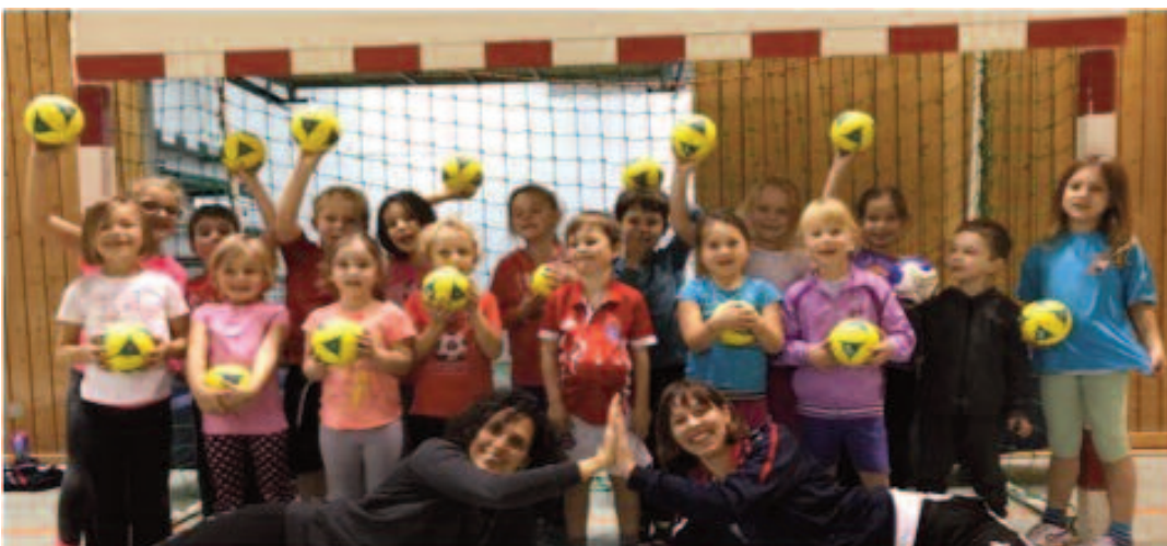
das Team in 2017