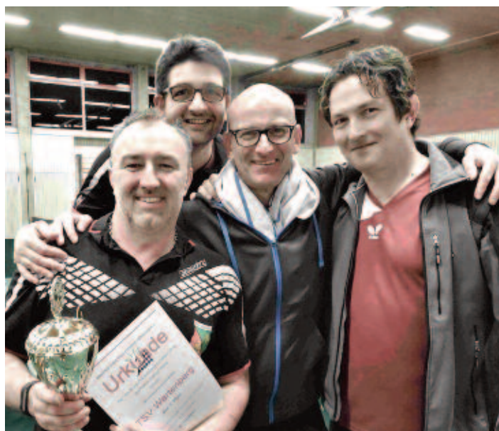
KREISPOKALSIEGER 2018 TSV Wartenberg